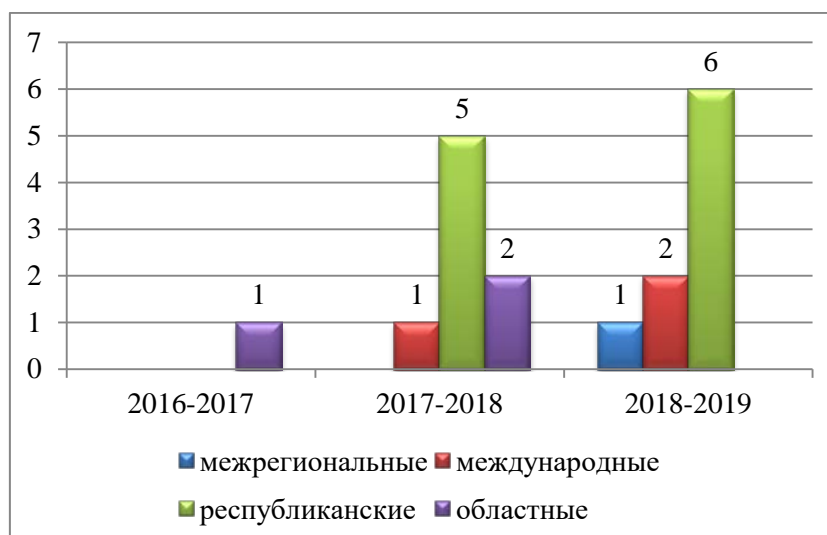
Рисунок 5. Преподаватели-призеры научно-практических конференций и конкурсов