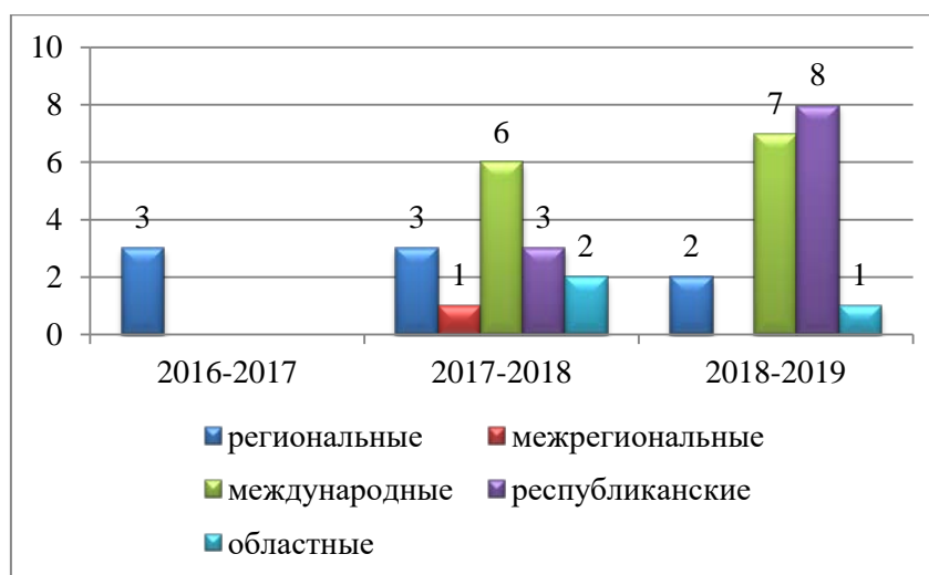
Рисунок 4. Студенты-призеры научно-практических конференций и конкурсов